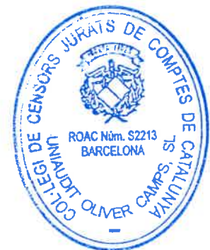
Blai Escoda Torres