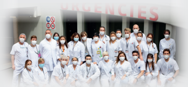
Equip del Servei general d'urgències (SGU) de l'Hospital Universitari Mútua Terrassa (HUMT)